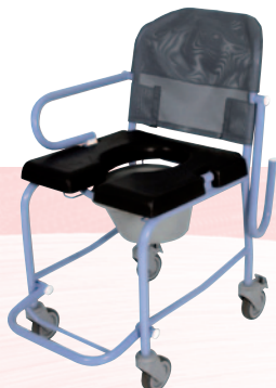
Nouméa 70/80 Sur roues.