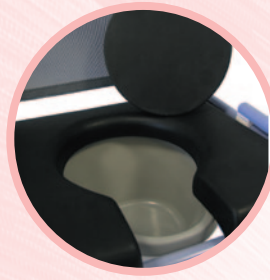
Assise percée confortable, bouchon en option sur Nouméa 60-80-100.