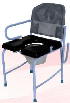
Nouméa 50/60 Sur patins.