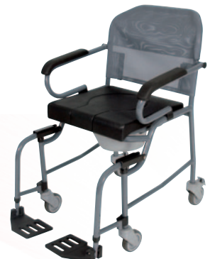
Nouméa 200 Repose-pieds escamotables.