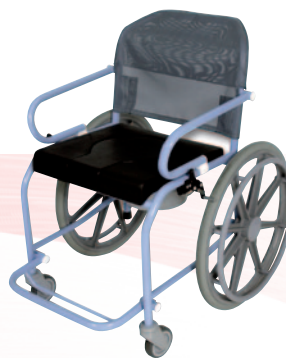
Nouméa 90/100 Roues arrière Ø 55 cm.