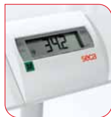
Le BMI du patient peut être calculé après avoir entré sa taille.

La fonction Indice de Masse Corporelle (BMI) de la balance seca 635 permet de déterminer facilement le statut nutritionnel du patient afin de prendre des mesures précoces. L'extinction automatique intégrée éteint automatiquement la balance après utilisation lorsqu'elle est alimentée par piles afin de prévenir toute consommation d'énergie inutile.