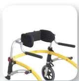
Cales de hanches