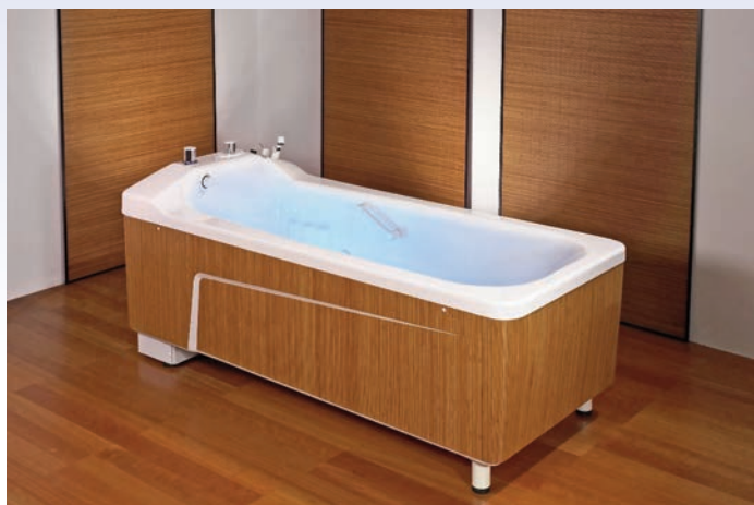
Baignoire Vivendo ® avec décor en bambou

La résistance aux chocs évite les éclats par contact éventuel avec un lève-personnes. Le nettoyage et la désinfection en sont fortement améliorés.