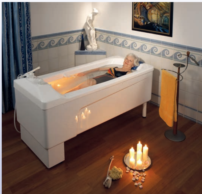
Baignoire Vivendo ® en position haute

La baignoire Vivendo ® est un modèle peu encombrant dont la forme intérieure est identique au modèle Calypso ®. Elle est parfaitement adaptée aux petites salles de bain.