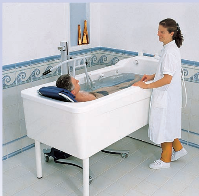
Baignoire Vivendo ® en utilisation de soin avec un élévateur en version brancard.

Le repose tête gonflable et le mitigeur thermostatique de remplissage 48 l/min sont fournis en standard avec les deux baignoires.