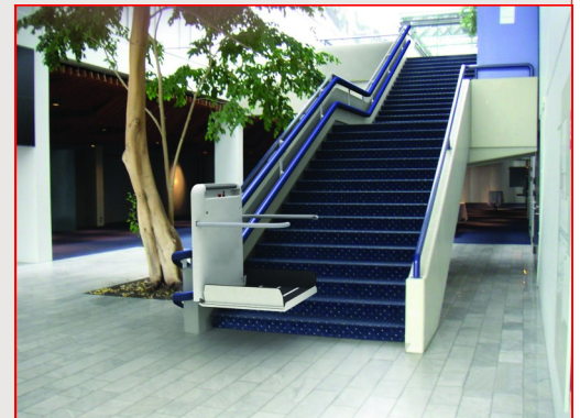
Fig. 1 : Simulation d'une installation / photomontage

Ce produit est conforme aux directives machines européennes 2006/42/CE et la la nouvelle norme EN81-40