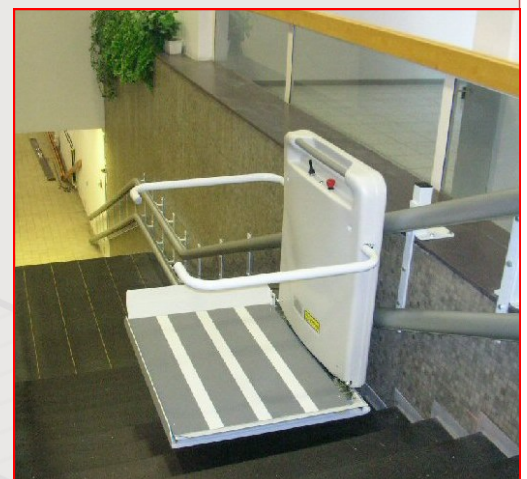
Fig. 2 : Installation avec palier