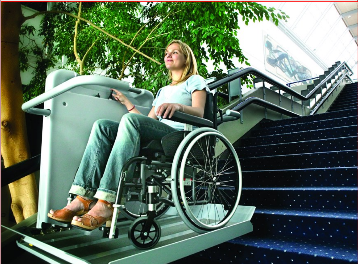
Plate-forme élévatrice BCCA pour escalier tournant