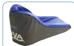
Protection en Promust CIC