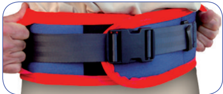
• Boucle auto-centreuse 50 mm