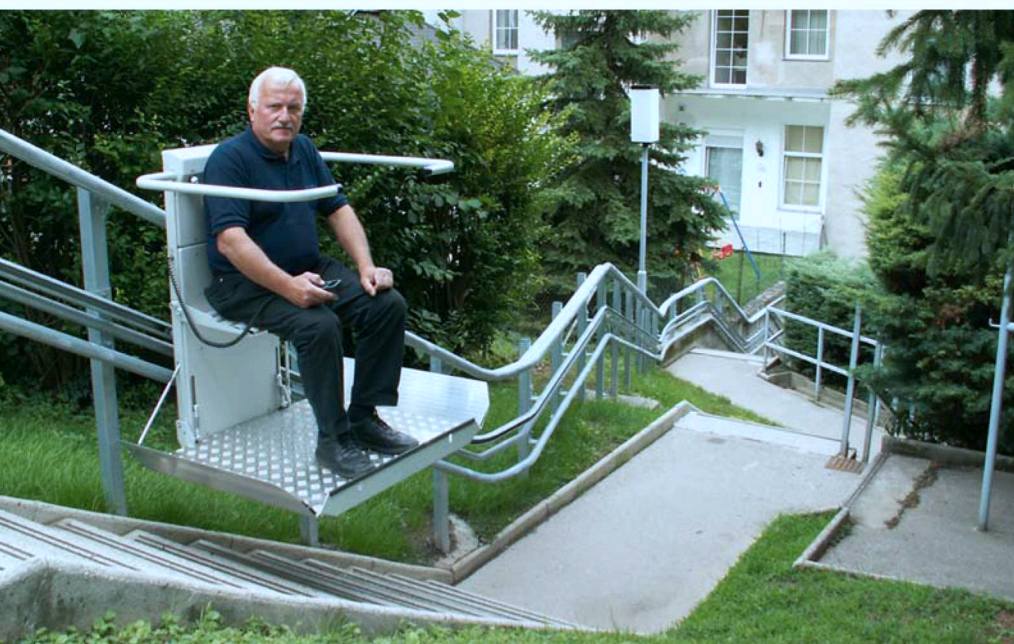
L'OMEGA est également une installation très fiable pour de plus longues distances dans les aires de jardin.