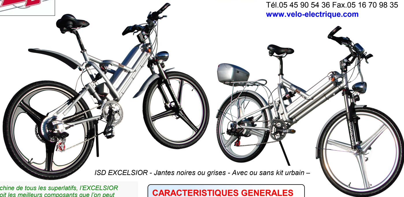
ISD EXCELSIOR - Jantes noires ou grises - Avec ou sans kit urbain -

Machine de tous les superlatifs, l'EXCELSIOR reçoit les meilleurs composants que l'on peut trouver sur un vélo. Un design à couper le souffle, des performances encore jamais atteintes sur un vélo électrique... Il va falloir s'accrocher fort à son guidon mais alors quelles sensations ! Ce vélo, entièrement monté dans nos ateliers, unique au monde, a été mis au point avec les meilleurs partenaires mondiaux (Grimeca, Hope, RST).