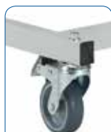
Roues Ø 75 mm.