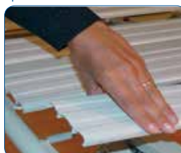
Large lattes amovibles en résine acrylique M2. Conçues pour plus de confort, d'hygiène, elles garantissent une anti-corrosion absolue.