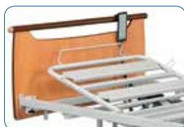
Relève-buste électrique (d'origine).

LE RELÈVE-BUSTE : différentes versions de relèvement de buste peuvent être choisies.