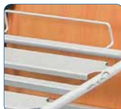
Large lattes métalliques soudées. Elles sont conçues pour un entretien facile.

LE COUCHAGE : le plan de couchage est constitué de lattes. Vous pouvez choisir entre :