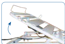
Relève-buste à translation. Il permet d'éviter le glissement avant.