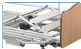
Relève-jambes électrique avec plicature.