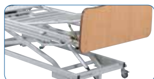
Relève-jambes manuel à crémaillères.

LE RELÈVE-JAMBES : différentes versions de relèvement de jambes peuvent être choisies.