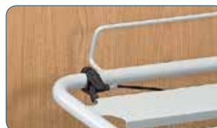
Débrayage d'urgence du relèvement de buste accessible en tête et des 2 côtés du lit.

LE RELÈVE-JAMBES : différentes versions de relèvement de jambes peuvent être choisies.