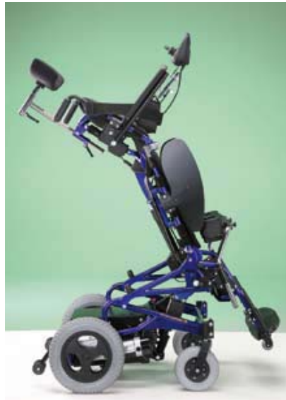
14.92HM Dossier inclinable électrique pour 18.64M