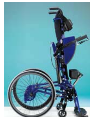
Vue en détail de la verticalisation manuelle assistée par le vérin à gaz.