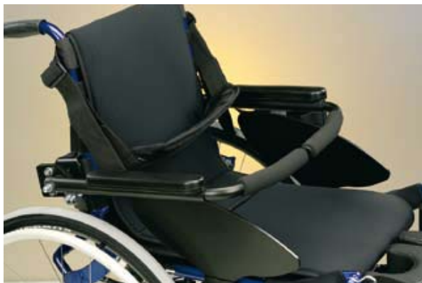
13.00/S Accoudoirs à fermeture avant avec double réglage.