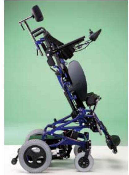
Bascule et verticalisation totale indiquée pour utilisateurs en état végétatif pour 18.64M