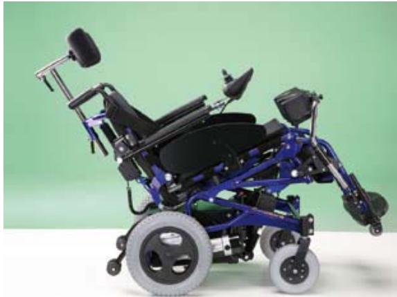
13.22HM Bascule d'assise électrique pour 18.64M