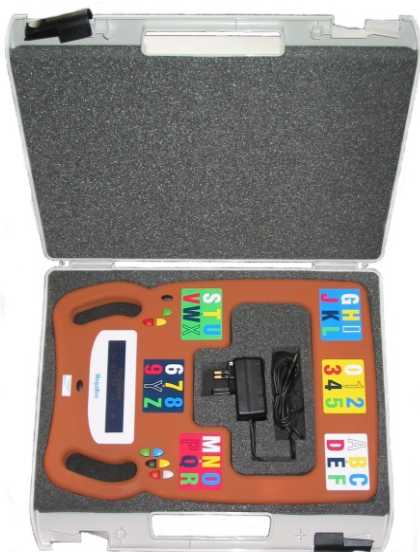
En photo, présentation de MegaBee® dans sa mallette de transport, avec chargeur.

À l'origine, la tablette MegaBee® a été mise au point avec l'aide de patients atteints du 'locked in syndrom' à l'hôpital de Stoke Mandeville, en Angleterre, mais l'appareil est désormais utilisé dans toute l'Europe auprès de patients atteints d'AVC, de sclérose en plaques et de maladies neuro-motrices.