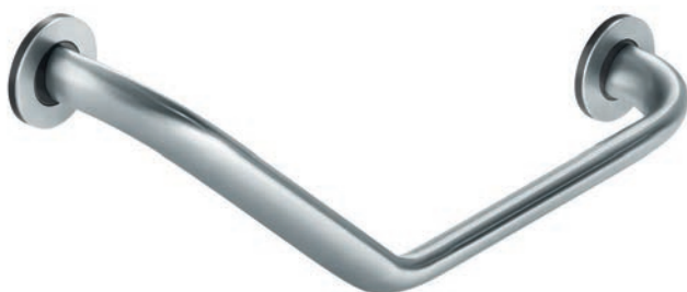
Illustration : gauche