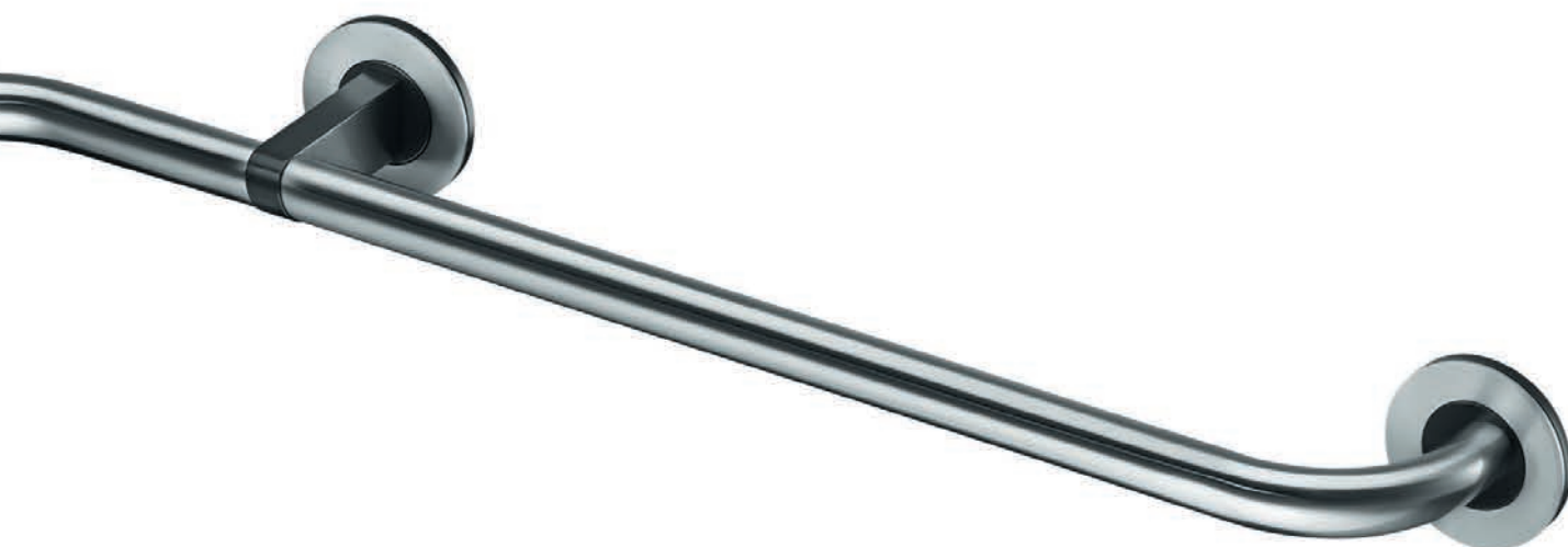
Illustration : gauche