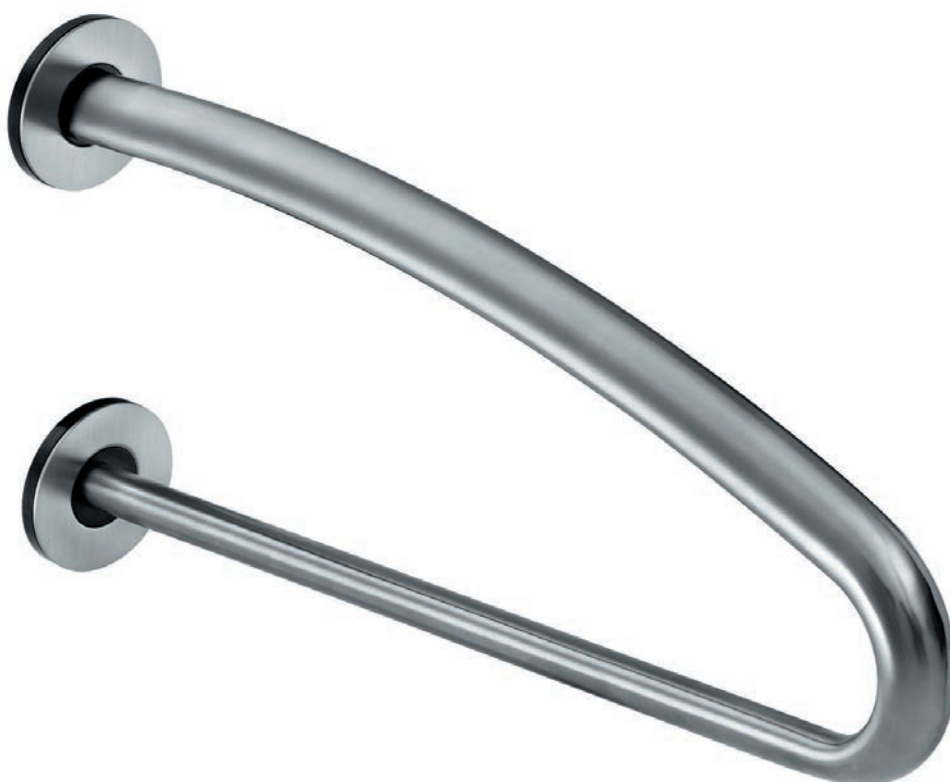
Illustration : gauche