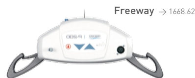
Freeway → 1668.62