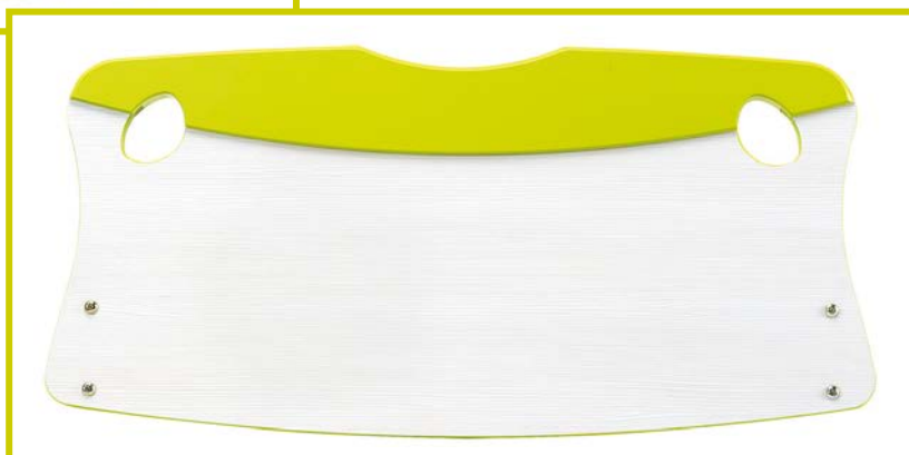
DOSSERETS BOIS "BAMBINO"