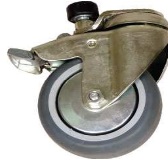
Roulettes unidirectionnelles (z)