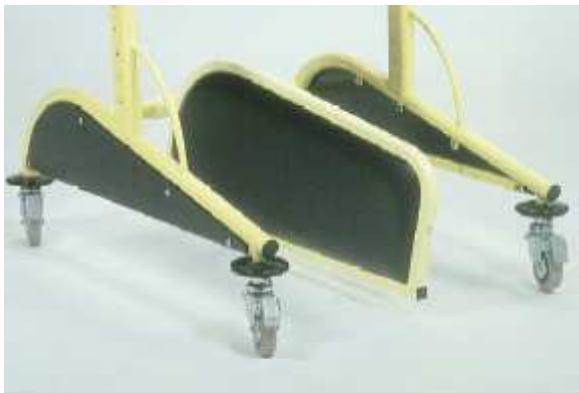
Séparateur de jambes