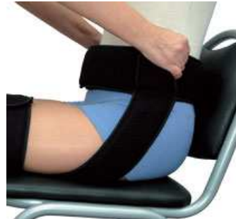
Ceinture de transfert