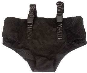
Ceinture de maintien pelvien