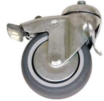
Roulettes avec blocage unidirectionnel (z)