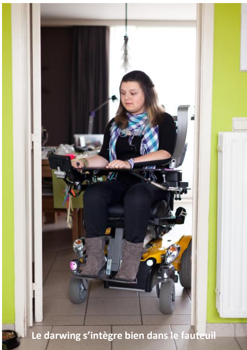
Le darwing s'intègre bien dans le fauteuil

www.aca-paramedical.fr/produits/aide-membres-supérieurs/