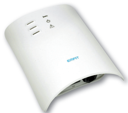
Moniteur de contrôle avec connexion possible sur votre système d'appel malade

Le capteur de lit Emfit est totalement indétectable car il est installé sous le matelas. Le signal alarme sera envoyé au plus vite en 5 secondes environ après que la personne ne soit plus sur le lit. Il est possible de régler un temps afin d'avoir un signal alarme différé. Cela donne la possibilité au patient de se lever pour aller aux toilettes et de revenir. En cas de non retour du patient dans un temps programmé, le signal alarme se déclenchera. Ce nouveau concept permet à l'équipe soignante d'être alertée et donc de se rendre au chevet du patient en cas de problème.