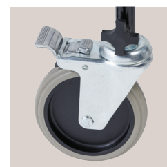
2 roues avec frein