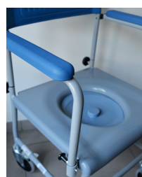
Accoudoirs amovibles et seau ultra jointif sous l'assise