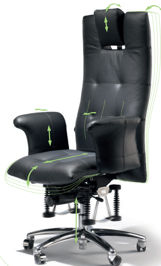
L'image représente le «bestseller»

☑ La profondeur de l'assise permet de personnaliser la profondeur de l'assise à la longueur des cuisses