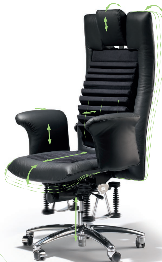
L'illustration représente l'équipement de série

Profondeur de l'assise: Cette fonction permet de personnaliser la profondeur de l'assise à la longueur des cuisses.