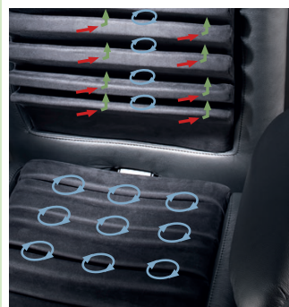
Technique des Lamelles: détente

Circulation de l'air (bleu) au niveau du dossier et de l'assise. Lamelles orientées en oblique soulagent activement les disques intervertébraux (rouge) Pression dorsale (vert) force de soulagement