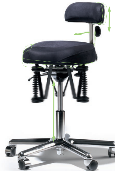
L'illustration représente l'équipement de série du «bestseller» (étoile alu - chromée, roulettes chromées)

⊗ Équipement du «bestseller» équipement caractéristique du «bestseller»