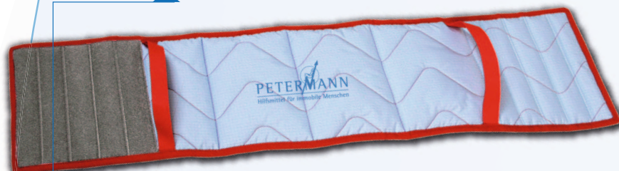
Cette Sangle de jambes s'ajuste parfaitement grâce à un large velcro.