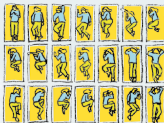
Phases du sommeil

"Finalement, un matelas professionnel pour usage domestique ! Je suis convaincue que ThevoCare est le meilleur matelas pour un sommeil réparateur. Il protégera longtemps mon indépendance et ma mobilité"