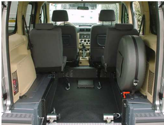
Divers types de fixation fauteuil roulant