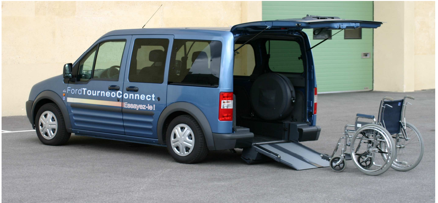
Portes AR battantes ou hayon, avec ou sans abaissement de suspension AR