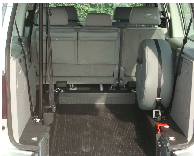
Configuration 5 places + 1 en FR