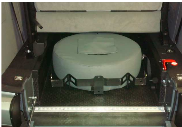
Installation roue de secours sous 3ème rangée en configuration 7 places

Véhicule de base à nous fournir: (neuf ou immatriculé)