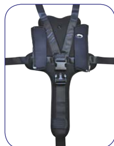
Module de Maintien Pelvien