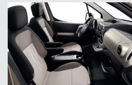
Ambiance Matinal / Garnissage Cadasca beige (disponible sur les niveaux Active et Family) (ambiance illustrée sur véhicule équipé d'une boîte de vitesses manuelle pilotée)