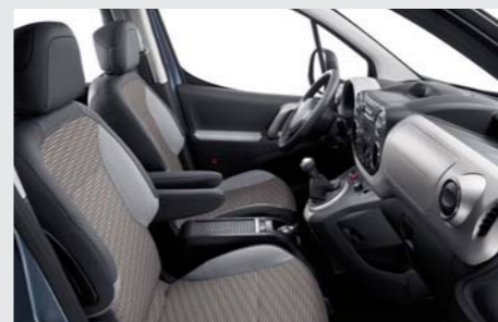
Ambiance Erable / Garnissage Spa (disponible sur niveaux Outdoor et Allure)