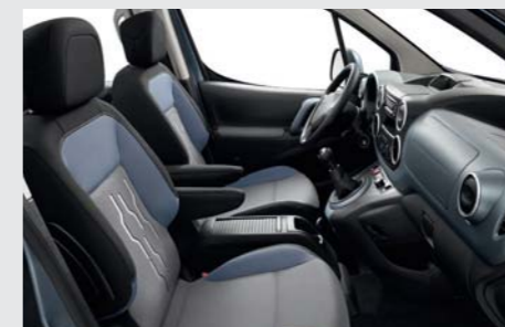
Ambiance Bise / Garnissage Cadasca bleu (disponible sur les niveaux Active et Family)