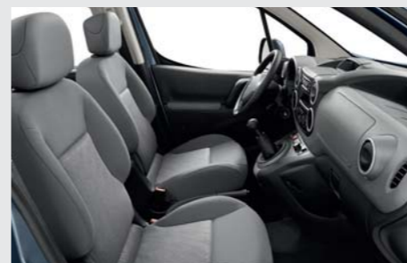
Garnissage Réseau (disponible sur niveau Access)