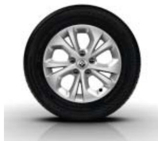
Jantes Alliage ARIA 15" en option sur Kangoo Zen et Intens et Grand Kangoo Intens