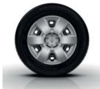
Enjoliveur 15" EGEE de série sur Kangoo Zen et Intens et Grand Kangoo Intens