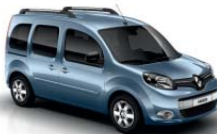
BLEU ÉTOILE (TE)