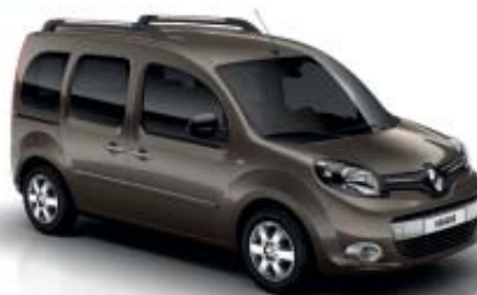
BRUN MOKA (TE)

OV : opaque verni ; TE : peinture métallisée Photos non contractuelles.