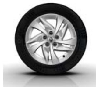
Jantes Alliage EGEUS 16" en option sur Kangoo Zen et Intens