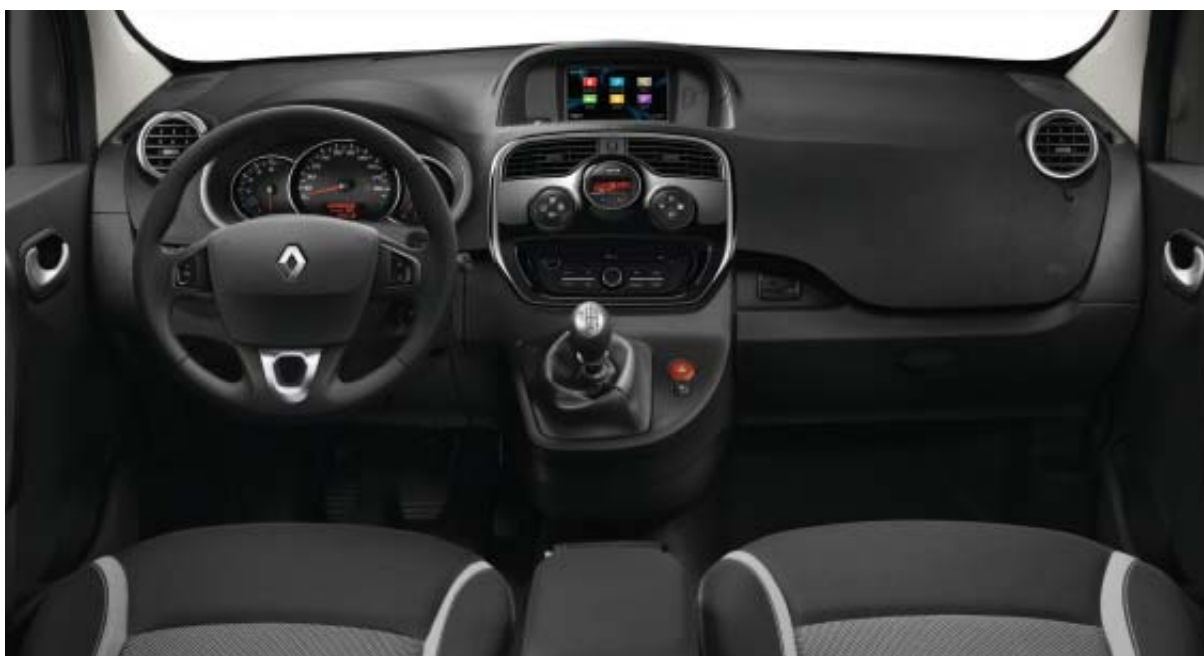
Modèle présenté avec Pack Navigation R-Link disponible en option.