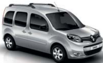
GRIS ARGENT (TE)