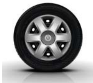
Enjoliveur 15" BRIGANTIN de série sur Kangoo et Grand Kangoo Life