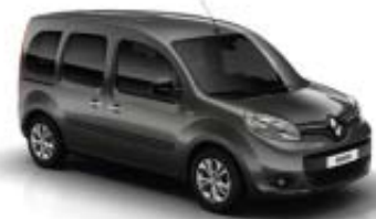
Kangoo ZEN avec option jantes Alliage Aria 15"

Rack de rangement au-dessus des places avant Régulateur et limiteur de vitesse Rétroviseurs extérieurs noir laqué réglables électriquement Sellerie Celcius Siège conducteur réglable en hauteur Tablette cache-bagages multipositions, escamotable derrière la banquette arrière Tapis de l'habitacle et du coffre en moquette