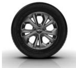
Jantes Alliage ARIA 15" Dark Métal de série sur Extrem