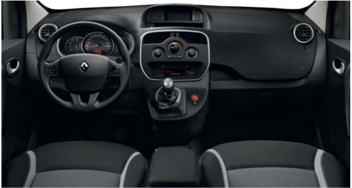
Modèle présenté avec radio fonction CD «R-Plug&Radio+» disponible en option.