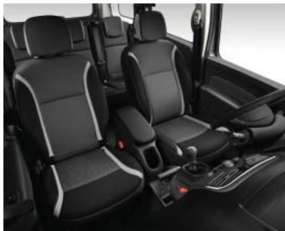
Sellerie CELCIUS de série à partir de Zen sur Kangoo de série sur Grand Kangoo