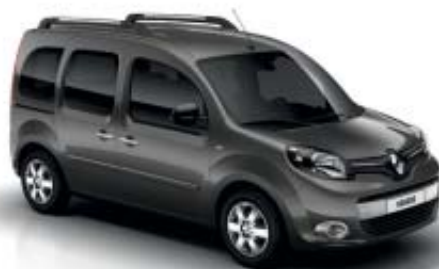
GRIS CASSIOPÉE (TE)