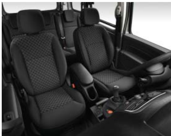
Sellerie TITANE de série sur Kangoo Life