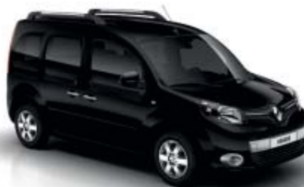
NOIR MÉTAL (TE)