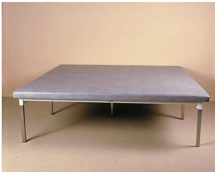
TABLE FIXE BOBATH TF1-3020 / TF1-3030