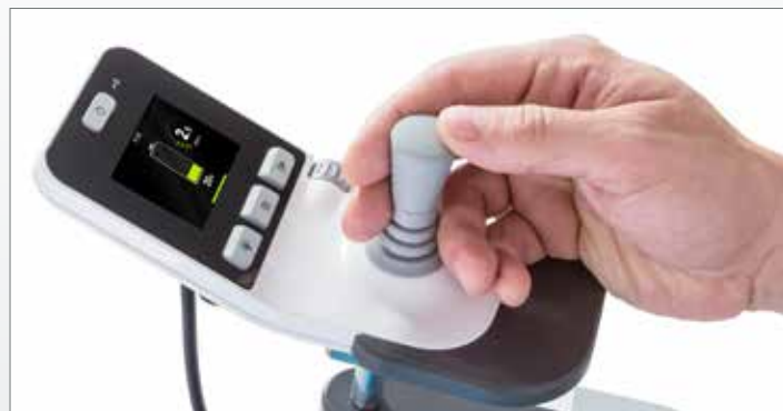
Écran couleur d'informations et éléments de commande conviviaux