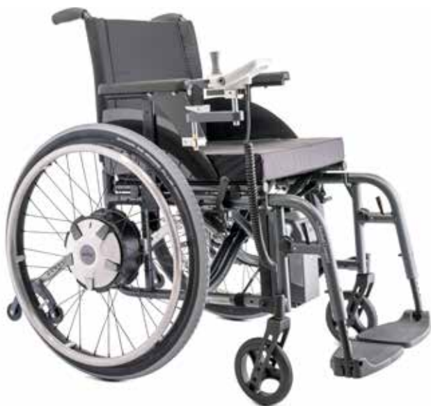
e-fix E36: Roues motrices plus puissantes que la version E35