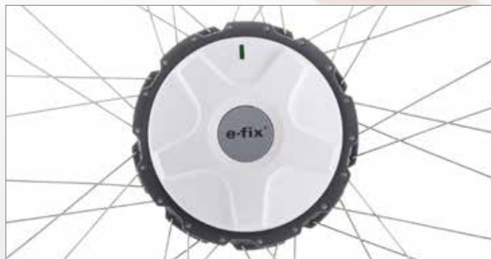
Motorisation compacte, légère, et puissante