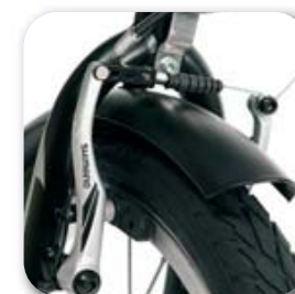
Frein système V-Brake