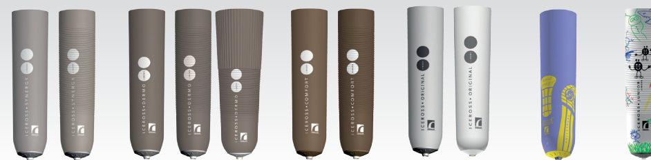
Iceross Synergy® Locking