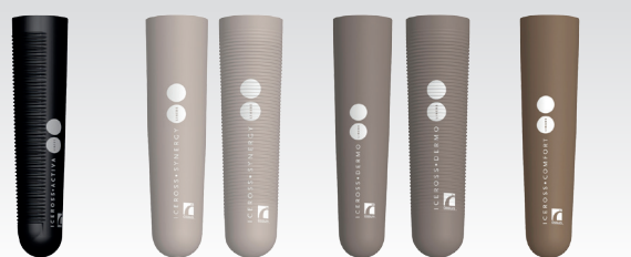
Iceross® Activa avec Tibiaguard