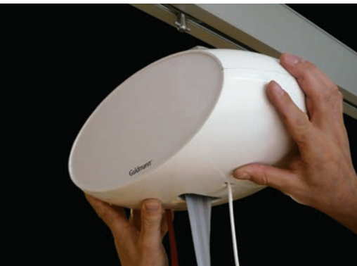
GH1 Q – système de montage/ démontage rapide