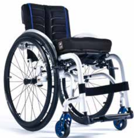
XENON 2 HYBRID LE PLUS RIGIDE