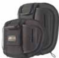
Dossier Jay J3 Carbon

Vous souhaitez passer d'une conduite dynamique à plus tranquille ou vice-versa? Modifiez simplement le réglage du centre de gravité en glissant le support d'axe sur les tubes d'assise. Et pour une posture plus ergonomique, n'oubliez pas de régler l'angle du dossier ou d'opter pour un dossier Jay J3 Carbon ... la combinaison idéale pour une vie active!