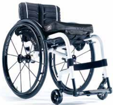
XENON 2 LE PLUS LEGER