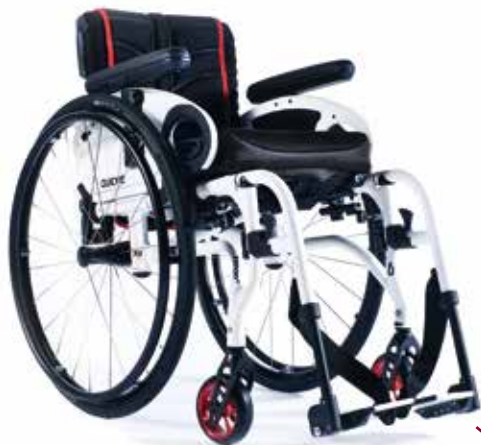
XENON 2 SA LE PASSE-PARTOUT