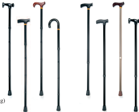
Beatrix Betty Bonny Britney - pliantes -