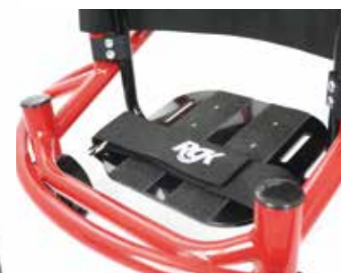
Repose-pieds réglables en hauteur et en angle.