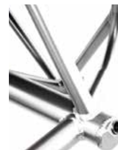
Barre de carrossage intégrée