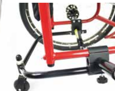
Centre de gravité réglable et roulette anti-bascule à démontage rapide.