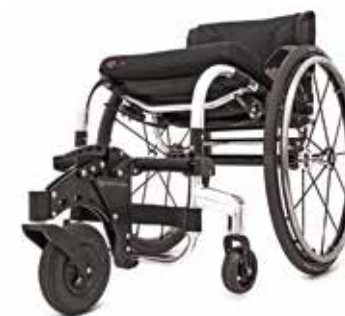
Roue avant tout terrain FrontWheel. Liberté maximale et facilité de propulsion quel que soit le terrain. Compacte, très simple à installer. Compatible avec Tiga, Tiga FX et Hi Lite.