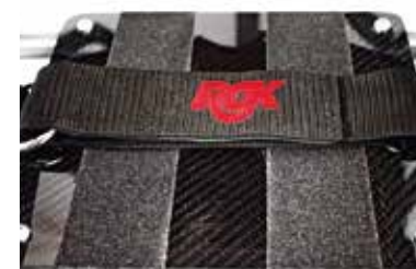
Repose-pieds intégré au châssis avec sangle de pieds