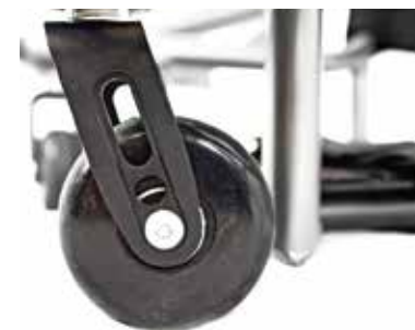
Fourche aluminium résistante et légère