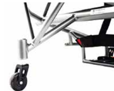
Roulette anti-basculé intégrée au châssis, réglable en hauteur (simple ou double)