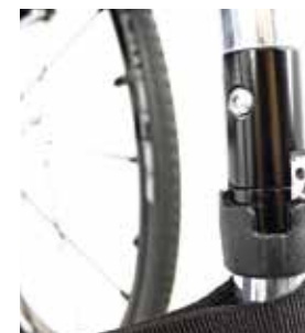
Système de pliage Q-lock du châssis avant.