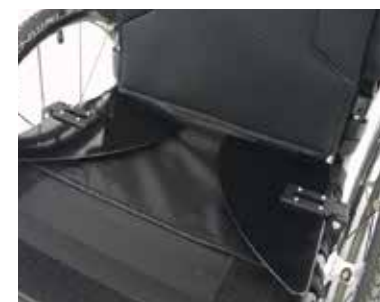
Protège-vêtements rabattables sur l'assise.