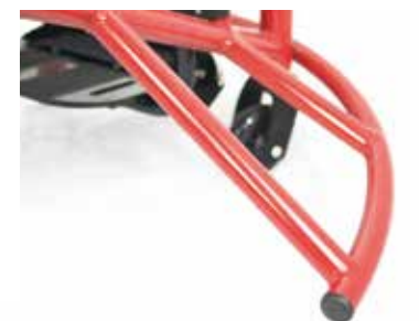
Barre d'attaque intégrée.