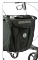
Grand filet / sacoche