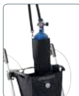
Panier avec support d'oxygène amovible