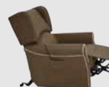
Invacare Porto NG

1639873 - 01/2017 - © Invacare International Sàrl 2017 - Tous droits réservés