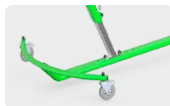
Déplacement du Mât pour positionner le centre de gravité