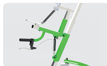
Inclinaison du corset-selle grâce à l'assistance « vérin »