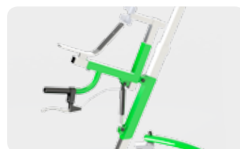
Inclinaison du corset-selle grâce à l'assistance « vérin »