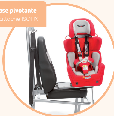
Embase pivotante avec attache ISOFIX