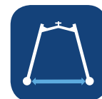
Largeur intérieure : pieds ouverts ▼