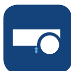
Distance du sol ▼