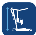
Hauteur hors-tout ▼