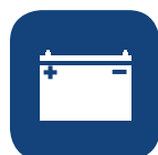
Nombre de cycles* ▼