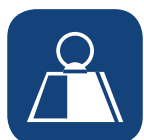
Poids total du produit ▼