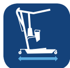
Longueur hors-tout de la base ▼