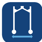
Largeur de la base ▼