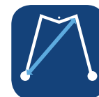
Rayon de braquage ▼