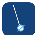
Diamètre des roues ▼