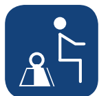
Poids max. utilisateur ▼

Toutes les mesures sont effectuées avec une personne de 80kg. Toutes les mesures sont effectuées avec une tolérance de + ou -3%.