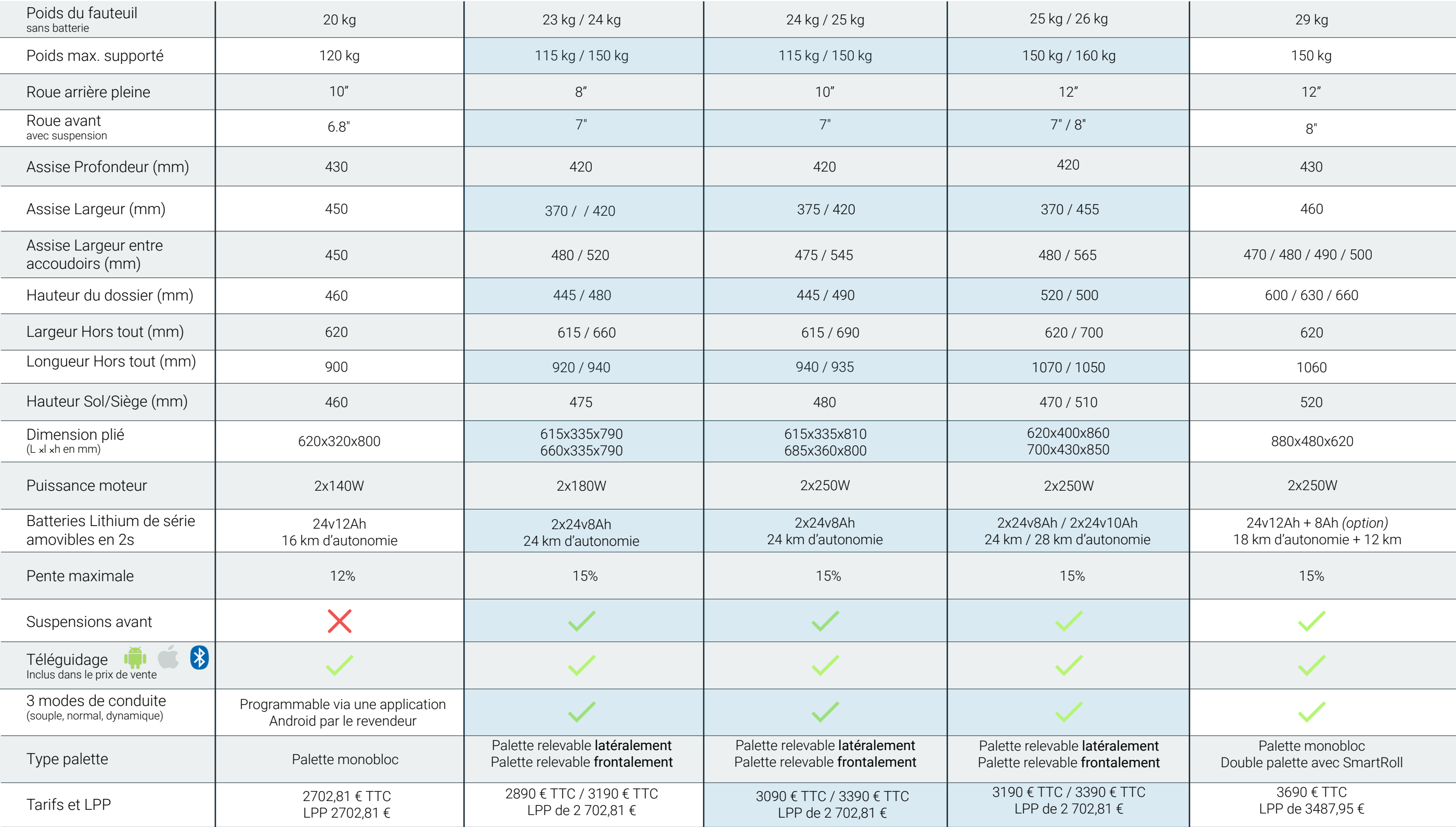
SmartChair EVO 2 3 tailles