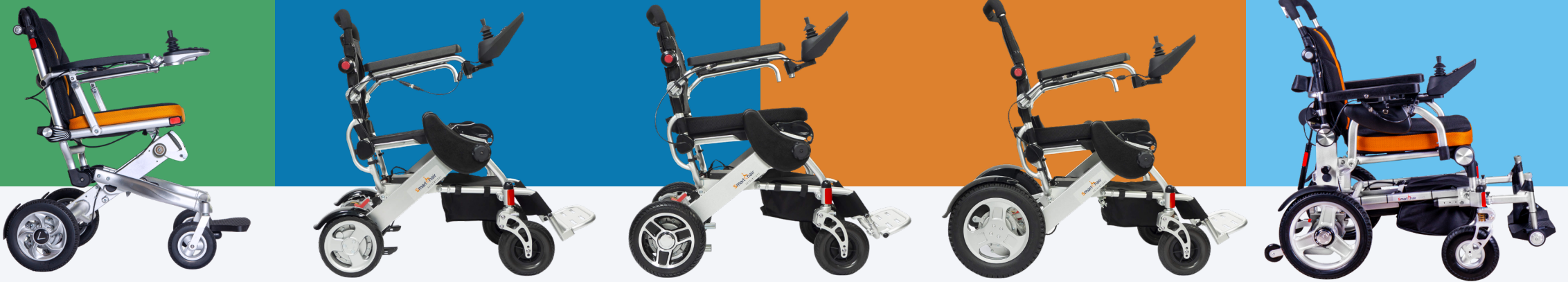
SmartChair Travel Standard