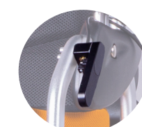
Levier d'inclinaison du dossier