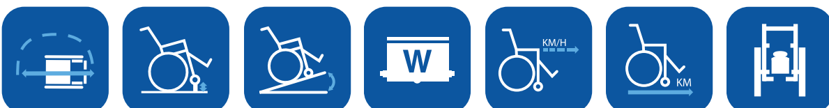
Diamètre de giration ▼