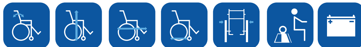
Inclinaison du dossier ▼

480 / 540 mm Flex 3 : 506 / 610 mm Matrix : 400 / 500 mm