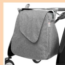
Weekend Bag N°ARTICLE : 5713504000586 ■ La/Lo/H : 38/17/35