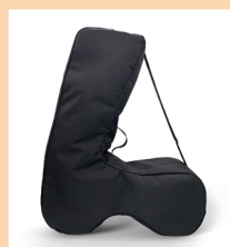
Housse de transport N°ARTICLE: 5713504001842