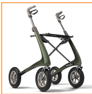
Carbon Overland vert

Rollator en carbone léger pour l'extérieur