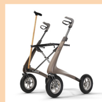
Porte canne N°ARTICLE GAUCHE : 5713504001873 N°ARTICLE DROITE : 5713504001781