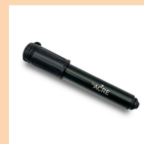
Mini Pompe N°ARTICLE : 5713504001941