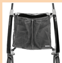
Grocery Bag N°ARTICLE : 5713504000210 ■ La/Lo/H : 37,5/12/34