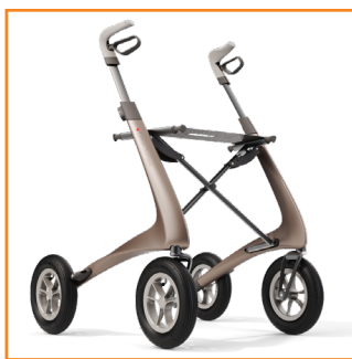
Carbon Overland brun