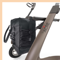
Daypack Bag N°ARTICLE : 5713504001774 ■ La/Lo/H : 35/16/33