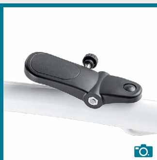
Pédale au pied pour réglage de la hauteur du châssis