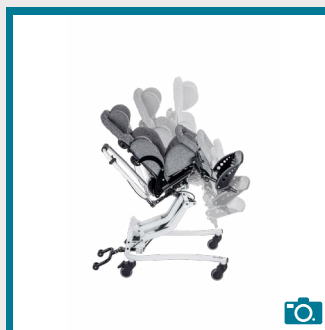
Réglage de l'inclinaison du châssis