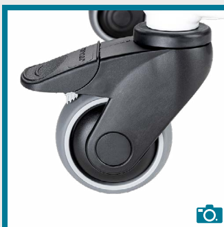
Roue avec freins