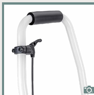
Barre de poussée avec poignée de réglage de l'inclinaison du châssis