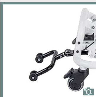
471A71=SK910 Anti-basculé ajustable en hauteur