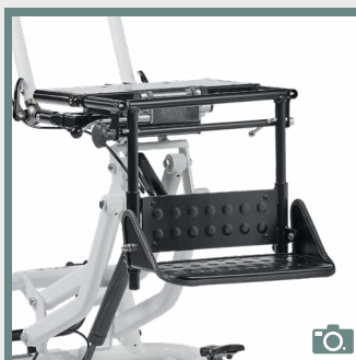
HR32692700-000 Repose-pieds pour interface d'assise