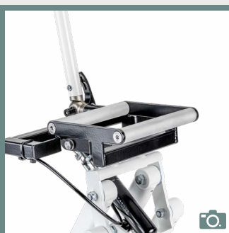
HR32582700-000 Interface d'assise pour corset siège