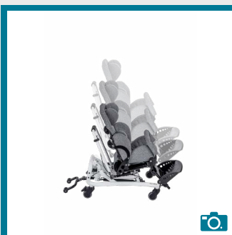
Réglage de la hauteur du châssis