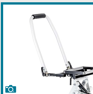
Barre de poussée ajustable en angle