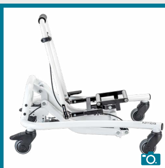
Pliable pour faciliter le transport et le rangement