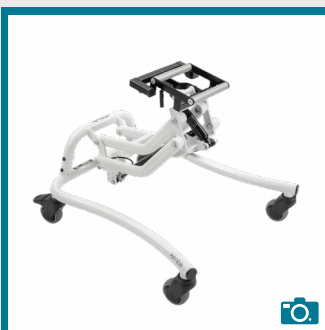
Équipement de série