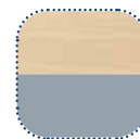
Hêtre/ bleu clair