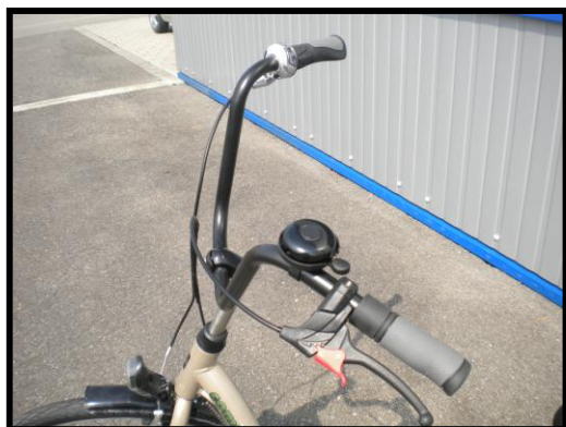
Guidon en forme de "U"

Le tricycle "Comfort" adopte une position semi-allongée. Avec une conduite confortable et une apparence élégante, tout est réuni pour vivre et sentir la différence.