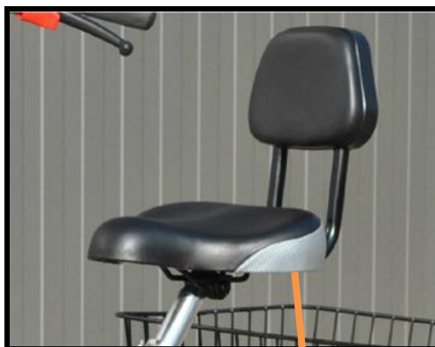
Selle avec appui-dos