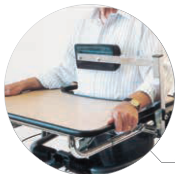
Appui dos inclinable (réglable hauteur, avant/arrière)